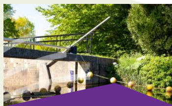
Ontwikkelingsperspectief en uitvoeringsprogramma buitengebied Ooststellingwerf